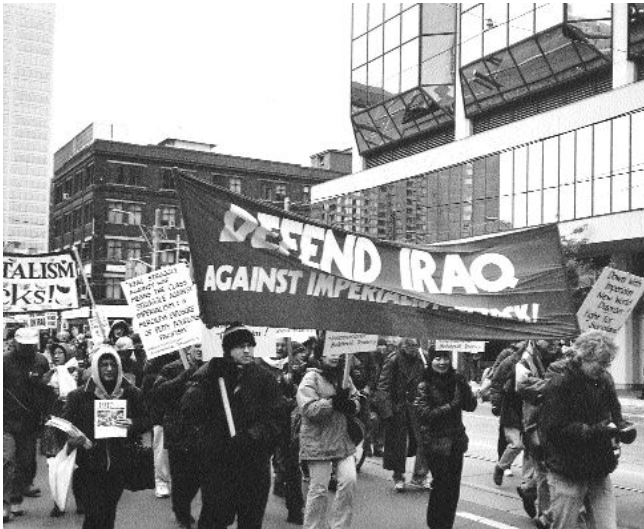
IBT-Kontingent am 16.11.02 in Toronto

Insbesondere ist der Gedanke grundfalsch, daß ein sogenannter demokratischer Frieden ohne eine Reihe von Revolutionen möglich sei." (Lenin: Die Konferenz der Auslandssektionen der SDAPR ; LW Bd. 21)