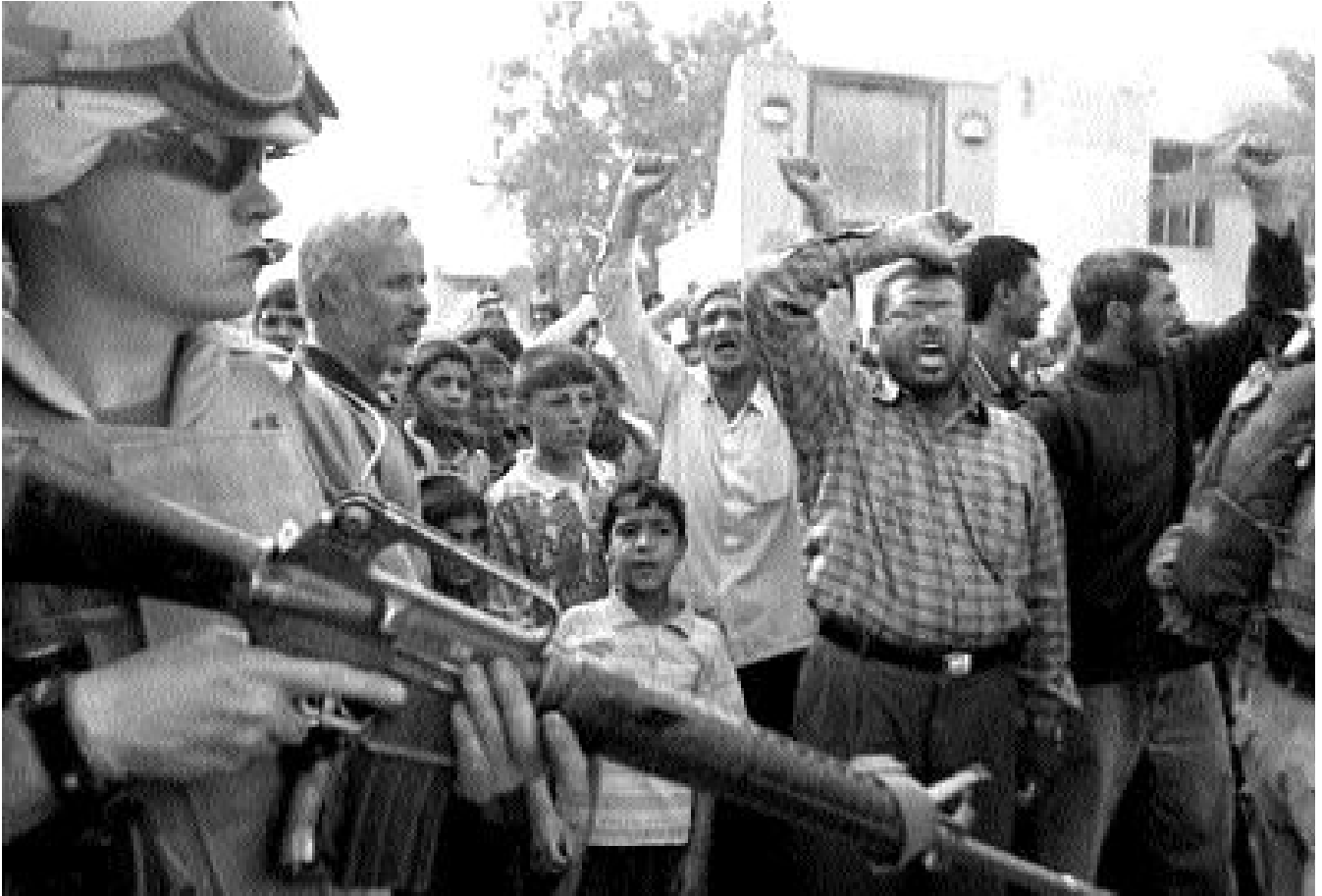
Irakische Demonstration gegen US-Besatzung