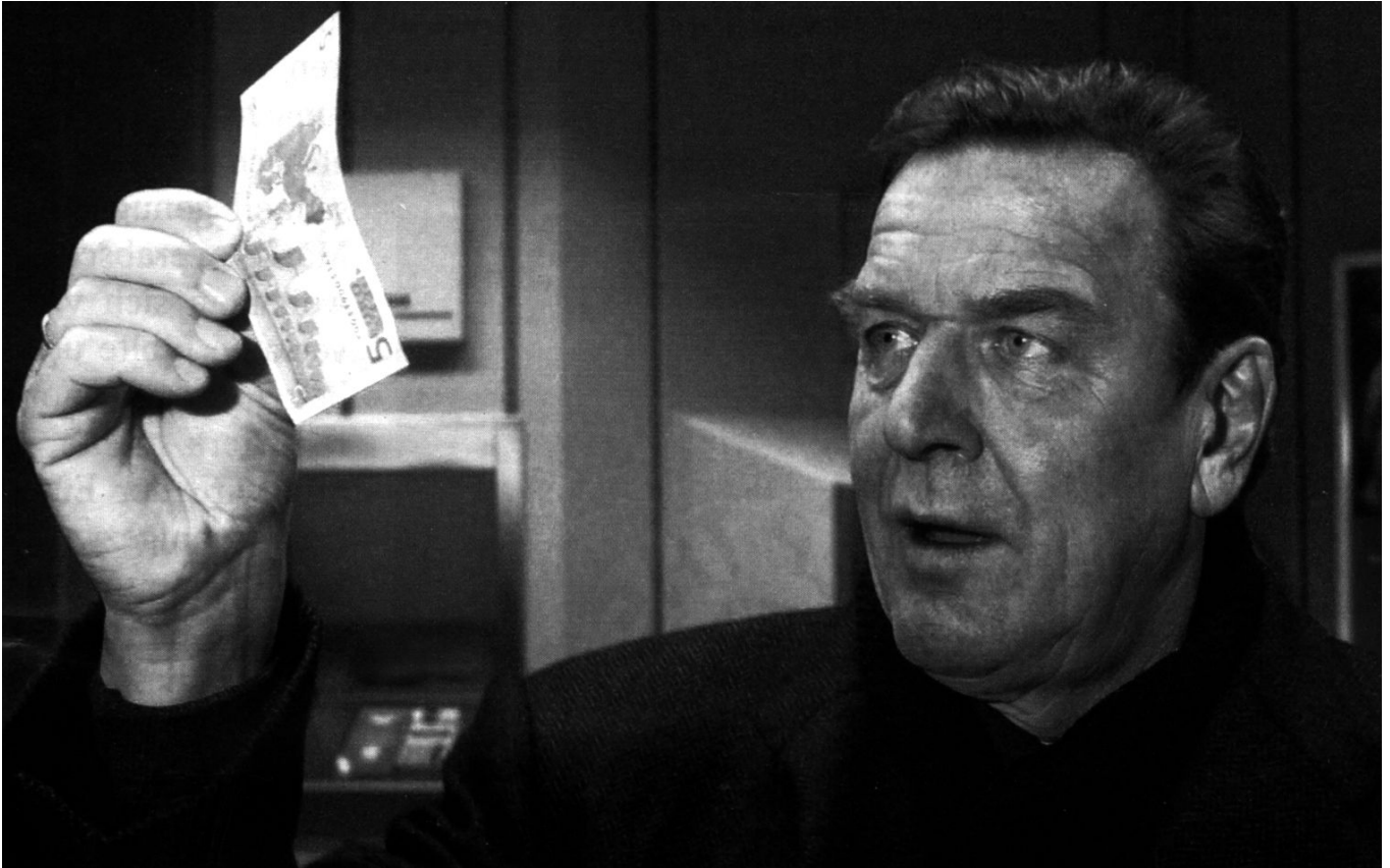
Immer fest im Blick: Die Profitmaximierung des deutschen Kapitals