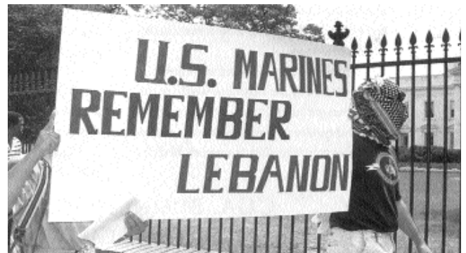
Demonstration vor dem Weissen Haus 1990

"In Brasilien regiert nun ein semi-faschistisches Regime, das jeder Revolutionär nur mit Hass betrachten kann. Lasst uns annehmen, England würde morgen in einen militärischen Konflikt mit Brasilien treten. Ich fra-